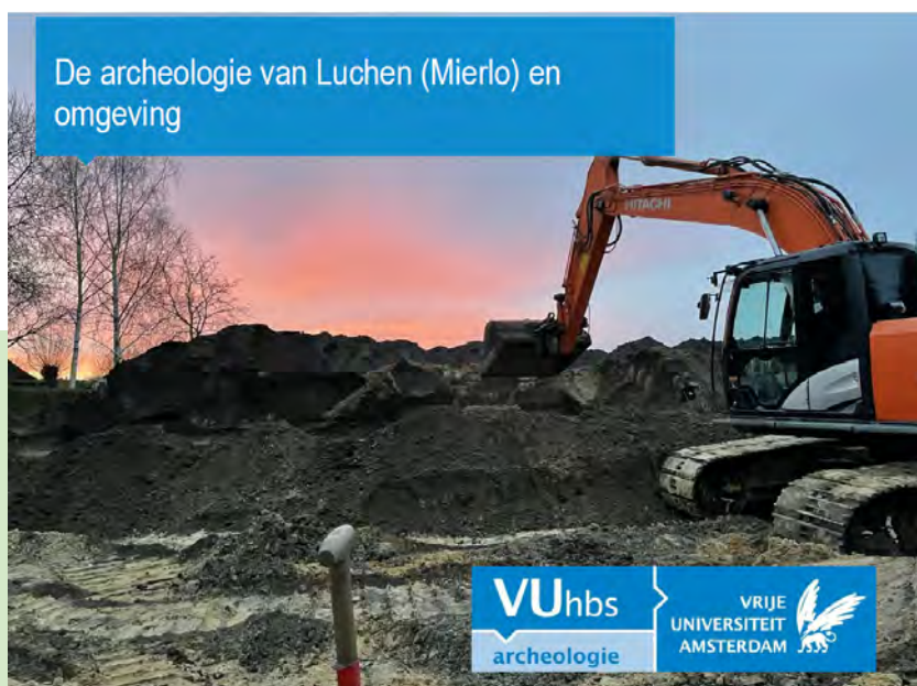
De archeologie van Luchen (Mierlo) en omgeving