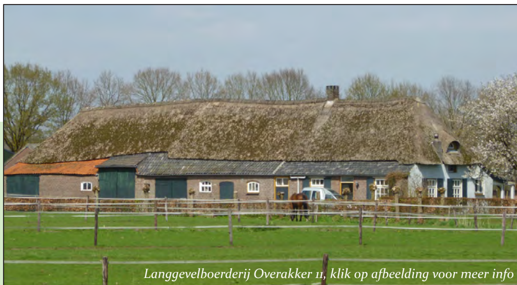
Langgevelboerderij Overakker 11, klik op afbeelding voor meer info

Voor het bestuur van Heemkundekring Myerle worden nieuwe bestuursleden gezocht. Dit is de kans om mee te doen in de vereniging en om HKMyerle nog sterker te maken dan die al is. Lees verder bij 'van de bestuurstaafel'.