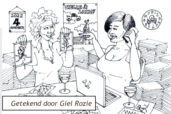
Getekend door Giel Rozie