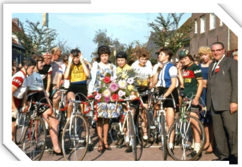
Wielrenners met de miss in het midden