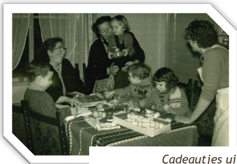
Cadeautjes uitpakken met Sinterklaas