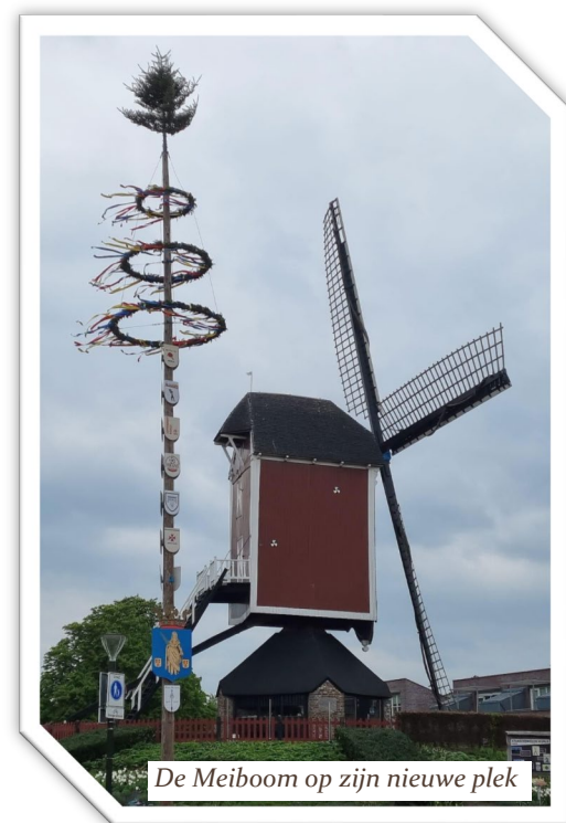
De Meiboom op zijn nieuwe plek