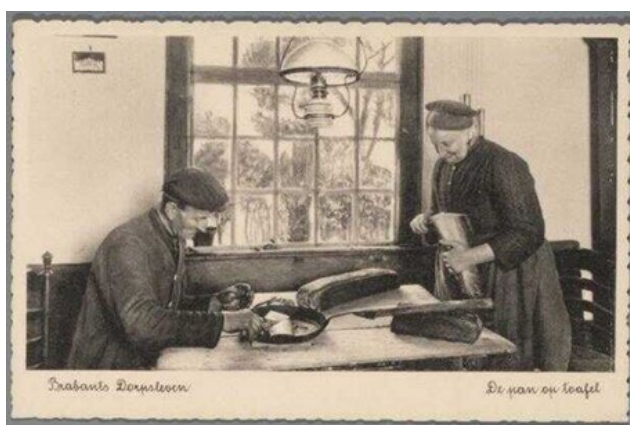
Ansichtkaart met man en vrouw in Noord-Brabantse streekdracht aan tafel. De vrouw snijdt het brood.

Deze nieuwsbrief wordt aangeboden door HKMyerle. Leden ontvangen deze automatisch. Andere belangstellenden kunnen zich aanmelden via onderstaand mailadres. Via dat adres kun je ook uitschrijven.