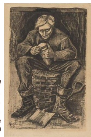
Prent van man die brood tegen zich aan snijdt. (Bron: Vincent van Gogh, Man die zijn brood snijdt, 1882, collectie Museum Boijmans van Beuningen)