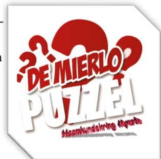
Komt de brand van 27 augustus 1921 ook in de Canon van Mierlo?

De tiende Mierlo puzzel is geweest. De antwoorden zijn ontvangen en worden nagekeken. De uitslagavond op de derde donderdag van januari kunnen we, gezien de huidige situatie, niet organiseren. Iedere inzender krijgt van ons bericht over de antwoorden en de uitslag. Ook zullen we laten weten hoe we de prijzen zullen uitreiken. Want we hebben weer mooie prijzen gekregen en die worden zeker uitgedeeld.