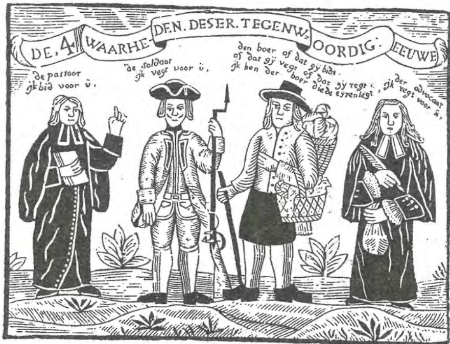
De vier standen van de achttiende-eeuwse Brabantse samenleving. De boer houdt de pastoor, de soldaat en de advocaat in leven: 'of dat gij bidt / of dat gij vecht of dat gij regt / ik ben der boer die de eyren legt'. Houtsneede, uitgegeven door P.J. Lecuyer (Uden / 's-Hertogenbosch) omstreeks 1773.