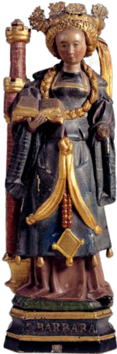
Beeldje van H. Barbara uit ca. 1520. (Catharijneconvent Utrecht).