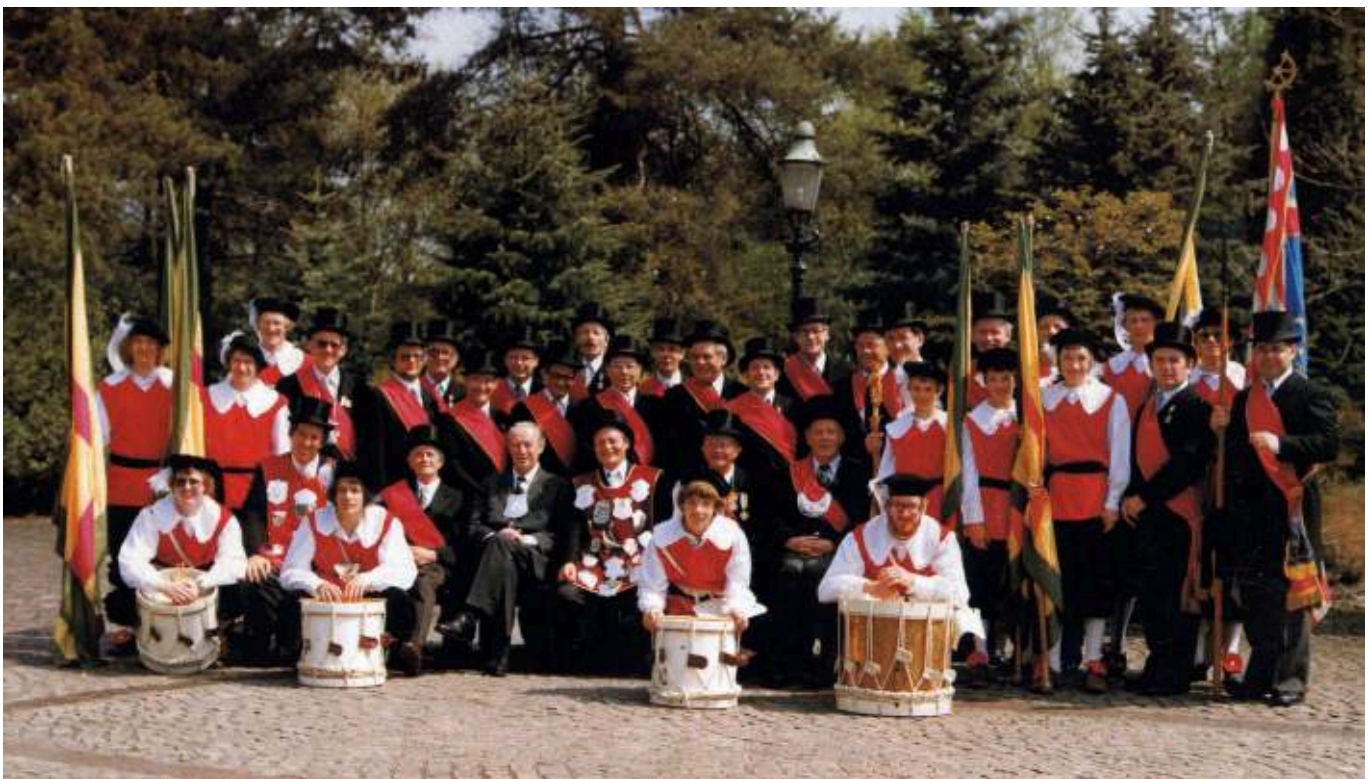
Het jubilerende gilde bij zijn 500-jarig bestaan in 1974.