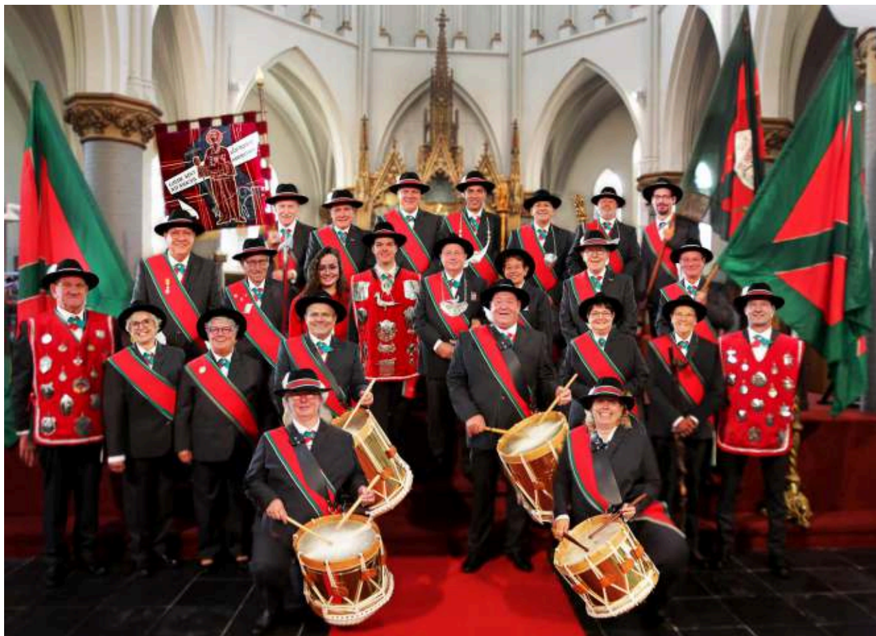
Gilde Sint Antonius Abt poseert in de Sint Luciakerk van Mierlo-Hout.