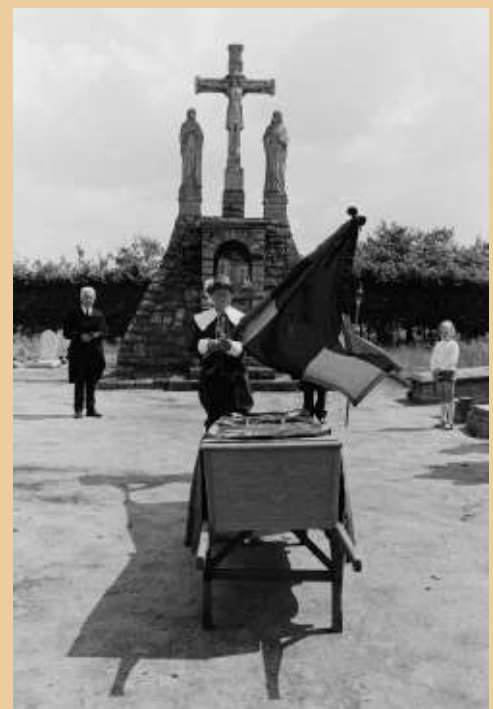
Vaandrig van het gilde Sint Antonius Abt brengt een laatste groet aan een overleden gildebroeder tijdens de uitvaart met gilde-eer op de H. Lucia begraafplaats.

Tot slot: "Een mooi moment zal ongetwijfeld ook zijn de viering van het 550-jarig jubileum van ons gilde op 16 juni 2024!"