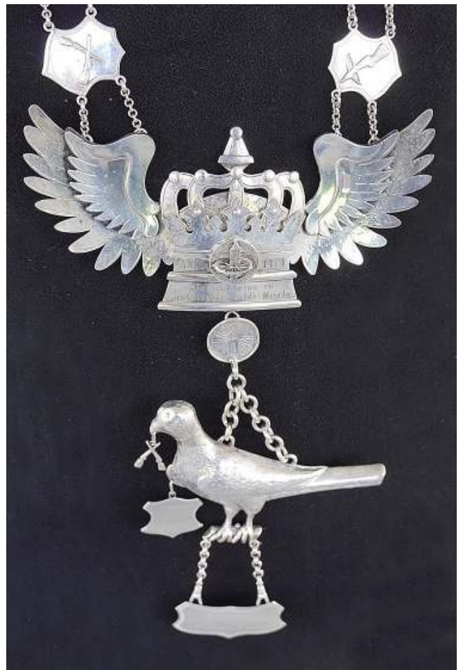
De nieuwe Koningsketen van 2014.

Onderaan de koningsketen wordt ieder jaar een klein zilveren plaatje gehangen met de naam van de (nieuwe) koning.