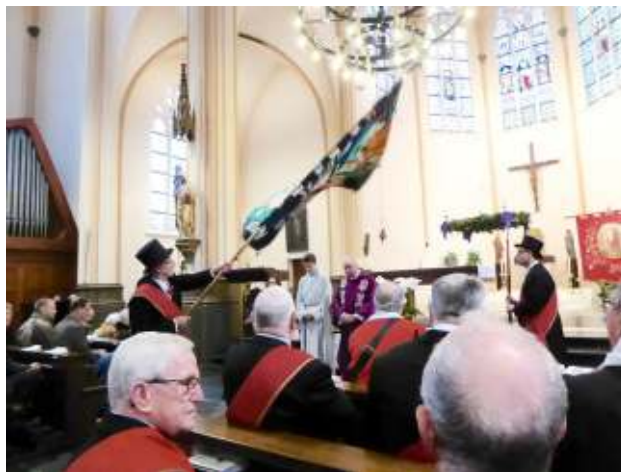
Eed van Trouw in de Heilige Luciakerk tijdens gildemis van 14 december 2016.

De houding van de landelijke en/of regionale overheid ten aanzien van gilden bleef tijdens de laatste twee eeuwen redelijk 'neutraal'. Er waren wel wat beperkingen tijdens de Eerste Wereldoorlog. Over het reilen en zeilen van de gilden in de jaren 1940-1945 is bijna niets gepubliceerd.