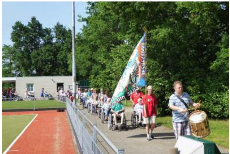
Ontvangst van bewoners van Hof van Bethanië bij het gildehuis, 25 mei 2018.