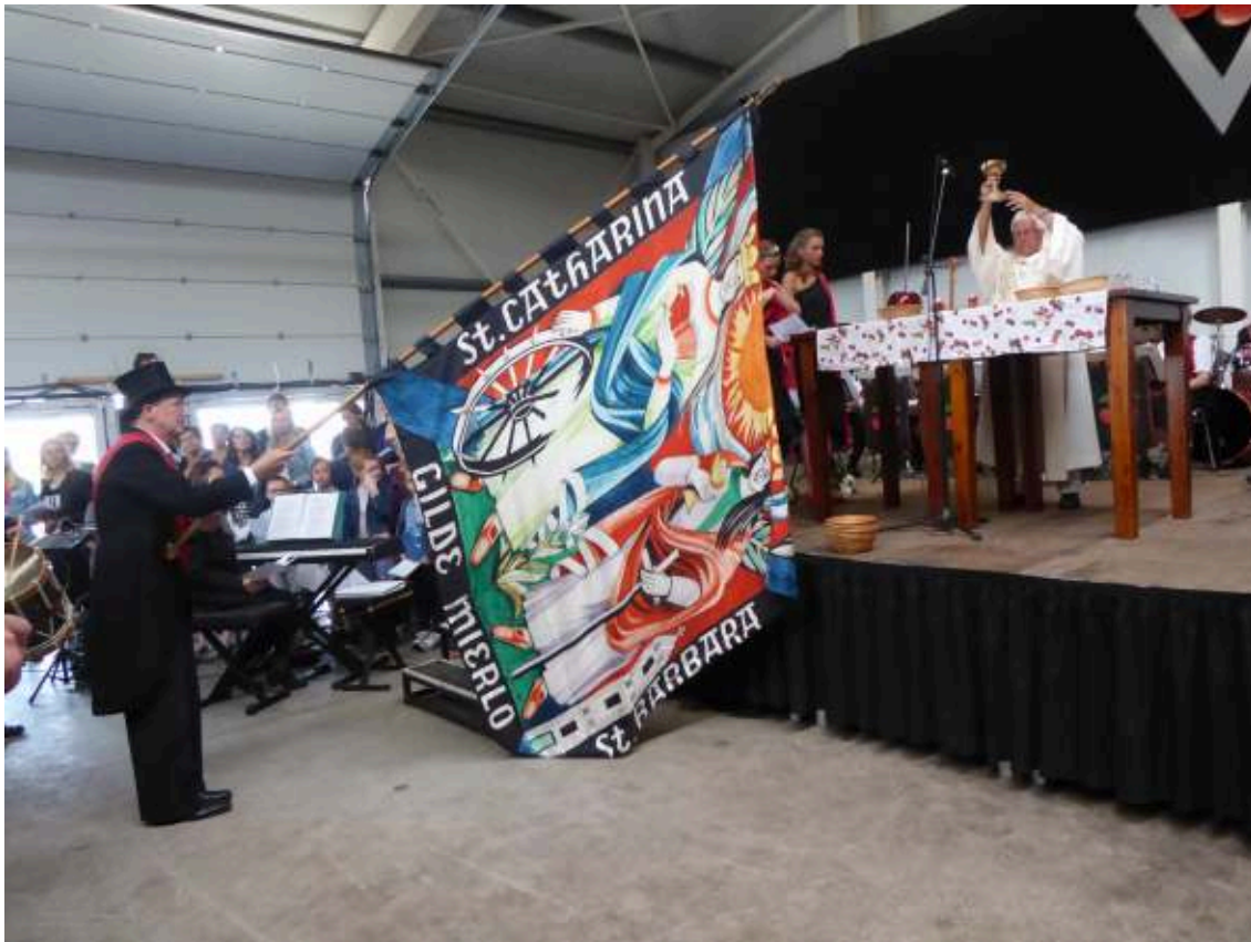
De vaandrig van Sint Catharina en Sint Barbara neigt het vaandel tijdens de 'kersenmis' in 2016.

Het vaandel symboliseert ook het gilde; dit betekent dat het vaandel gegroet dient te worden door derden. Als het gilde opmarcheert voor de eretribune, biedt de vaandrig het vaandel aan de toeschouwers aan om gegroet te worden. Hij doet dat door als het vaandel staande gedragen wordt (dat betekent rechtop voor de borst van de vaandrig) het vaandel langzaam naar voren te buigen om het doek met symbolen en afbeeldingen goed te laten zien of als het vaandel liggend gedragen wordt (over de schouder van de vaandrig) de standaard waaraan het vaandel bevestigd is iets los te laten komen van de schouder. Deze bewegingen moeten dus niet gezien worden als groet door het vaandel, maar als actie van de vaandrig om het vaandel te tonen en aan te bieden aan de toeschouwers om gegroet te worden.