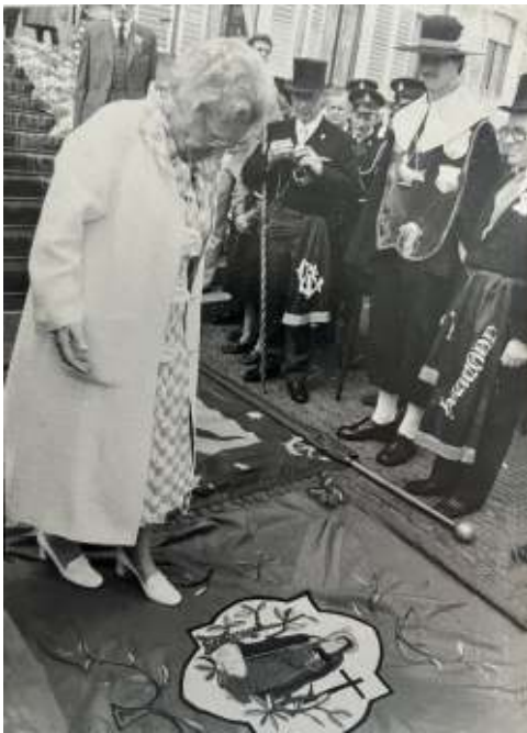
Hare majesteit koningin Juliana schrijdt over het vaandel van Sint Antonius Abt bij het bezoek aan Soestdijk.