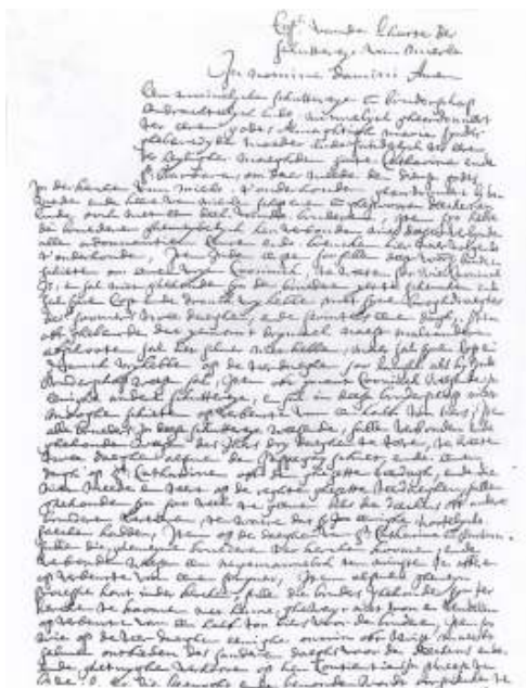
De eerste Caerte of reglement van 1556 - 1560.

Uit de annalen blijkt verder dat de gilden in de 2e helft van de 19e eeuw steeds meer betrokken werden bij feestelijkheden in het dorp en dat ze meer waardering kregen. Sinds 1888 is het gilde bij alle feestelijkheden in het dorp vertegenwoordigd