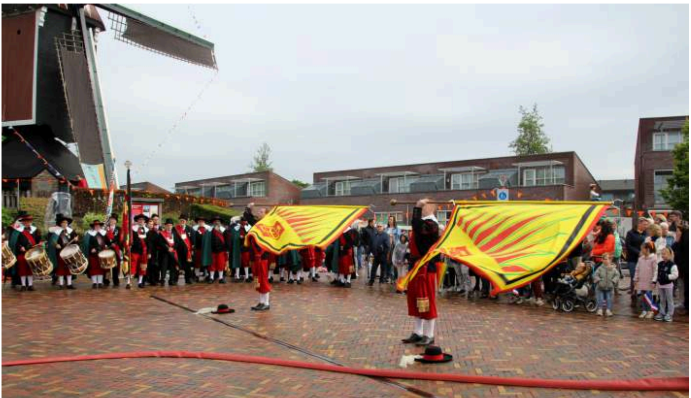
De vendeliers zwaaien hun vaandels voor God, koning en vaderland.

Dit werd later anders. De tamboers (en vendeliers) konden tegen een verlaagde jaarlijkse contributie volledig lid worden van het gilde, en (dus) ook koning of lid van de overheid. De tamboers en vendeliers kregen een eigen gildekostuum: een rood pak. In een van de oudere statuten (de Caerte van 14 april 1959)