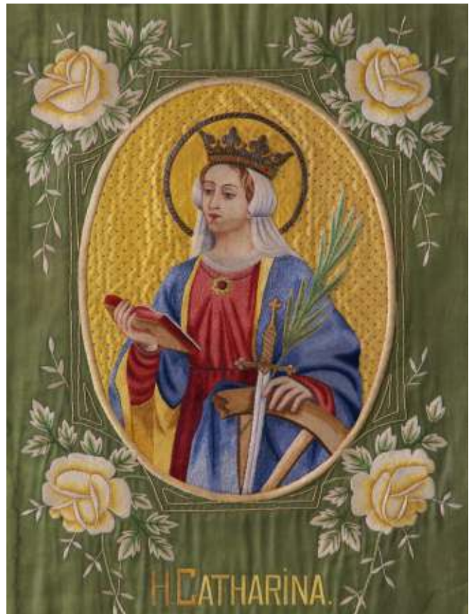
H. Catharina van Alexandrië op de achterzijde van het vaandel van de 3e Orde van de H. Franciscus (H. Luciakerk Mierlo).

Catharina wordt sinds de 9e eeuw vereerd, nadat op de berg Sinaï het gaaf bewaarde lijk van een jonge vrouw was gevonden. Zij wordt afgebeeld als een mooi, goed gekleed, jong meisje, gekroond, met zwaard, (kapot) spakenrad, boek en een palmtak als symbool van de overwinning, maagdelijkheid en martelaarschap. Catharina is net als de Heilige Lucia, een van de zeven primaire heiligen van de R.K. kerk. Ze is onder andere de patrones van steden als Venetië en Eindhoven.