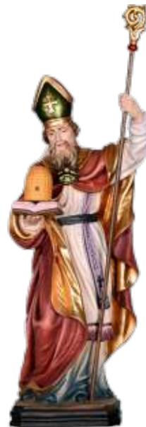
St. Ambrosius is de patroonheilige van de imkers.

Uit de gegevens blijkt dat het gilde ook een teerdag hield, net als de schuttersgilden. Gezien de uitgaven voor bier moet het een gezellige broederschap geweest zijn. Het gilde had zelfs een bijenlied ('Liet van het Bieken'). Ook dit gilde had een reglement waarin de rechten en plichten van de leden vastgelegd waren. Uit de documenten blijkt niet dat dit Mierlose gilde ook een schuttersgilde was, hetgeen in een aantal andere plaatsen wel het geval was. De feestdag van patroonheilige St. Ambrosius wordt op 7 december gevierd