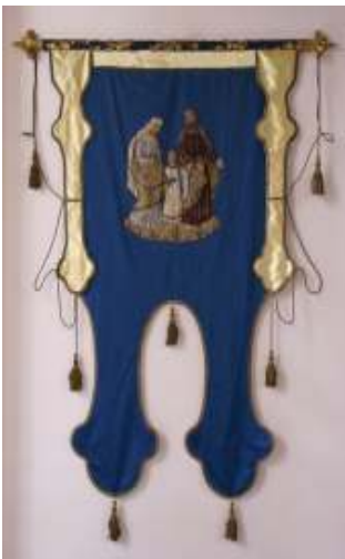
In 1872 schonk de Mierlose bevolking een blauw vaandel met de afbeelding van de Heilige Familie aan de parochie.

Voortplanting des Geloofs, de Broederschap van de Allerheiligste Drievuldigheid, de Broederschap van de Onbevleete ontvangenis van de Heilige Maagd en de Broederschap van de Sint Pieterspenning. Al deze broederschappen waren erop gericht om de binding met de R.K. kerk te verstevigen in het rijke Roomse leven. Hoewel ze allemaal broederschap genoemd