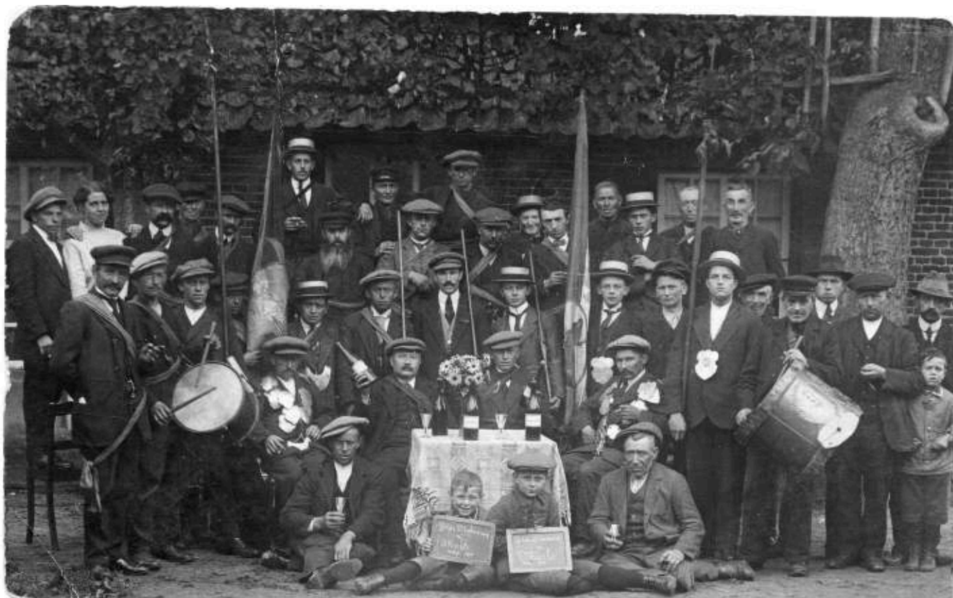
De gilden Sint Sebastiaan en Sint Catharina gebroederlijk samen op 14 september 1919.