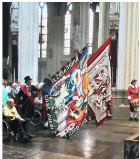
Neigen van het hoofdvaandel (met die van het gilde Sint Catharina en gilde St Barbara Geldrop) tijdens de mis op 31 mei 2016 in de Sint Jan Basiliek te 's Hertogenbosch.