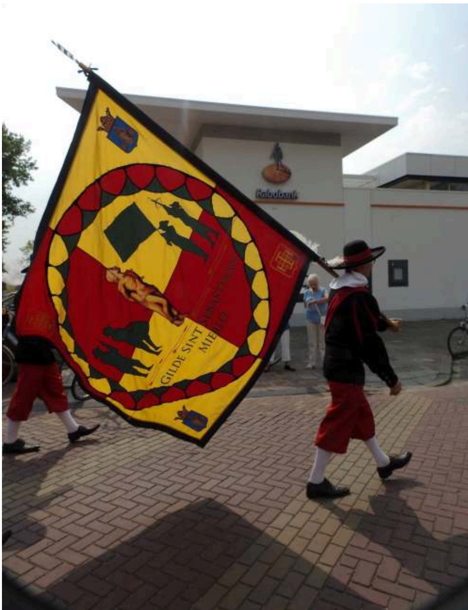
De vaandrig van Sint Sebastiaan Mierlo draagt het vaandel liggend.

buitenwereld en onderscheidt het gilde van de andere gilden. Het vaandel is bij alle gilden een zeer kostbaar attribuut dat met grote zorg wordt ontworpen en gemaakt. Er zijn voorbeelden bekend van vaandels die met de hand geborduurd zijn en waarin meer dan 2000 uur arbeid zitten.