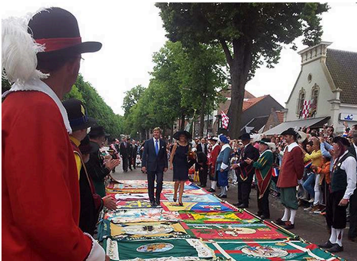
Het betreden van de hoofdvaandels van vele gilden door Koning Willem-Alexander en Koningin Maxima bij hun eerste officiële bezoek aan Noord Brabant 12 juni 2013, na hun inhuldiging.

aanwezig op het Engelse Ereveld voor de dodenherdenking. Sinds 1999 zijn de gilden elk vijfde jaar present op de bevrijdingsherdenking op in september, eveneens op het Engelse Ereveld. Tenslotte zijn ze er – sinds 2019 – elk jaar bij tijdens de herdenking van de bevrijding van Peelland, in telkens andere gemeenten, met vrijwel alle gilden uit de dorpen in de Peel en Noord-Limburg. In het eerste coronajaar was deze herdenking op het Engels Ereveld in Mierlo.