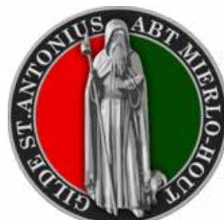
Logo's van de drie Mierlose schuttersgilden.