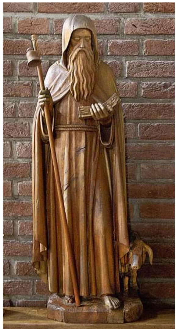
H. Antonius Abt, beeld uit de Sint Luciakerk Mierlo-Hout.