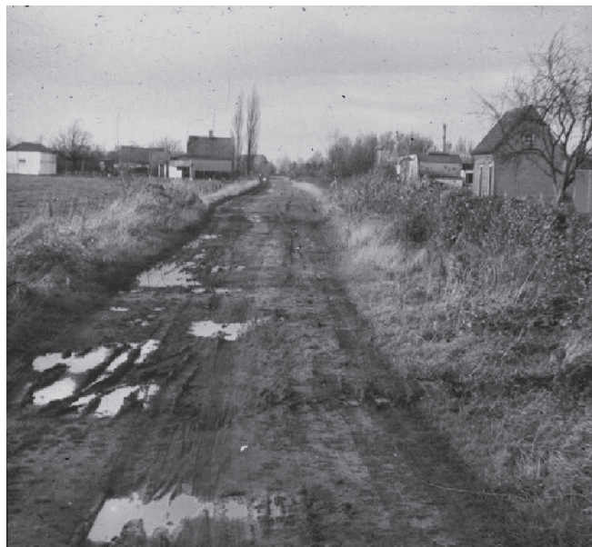
De Brugstraat toen, later Trambrugweg