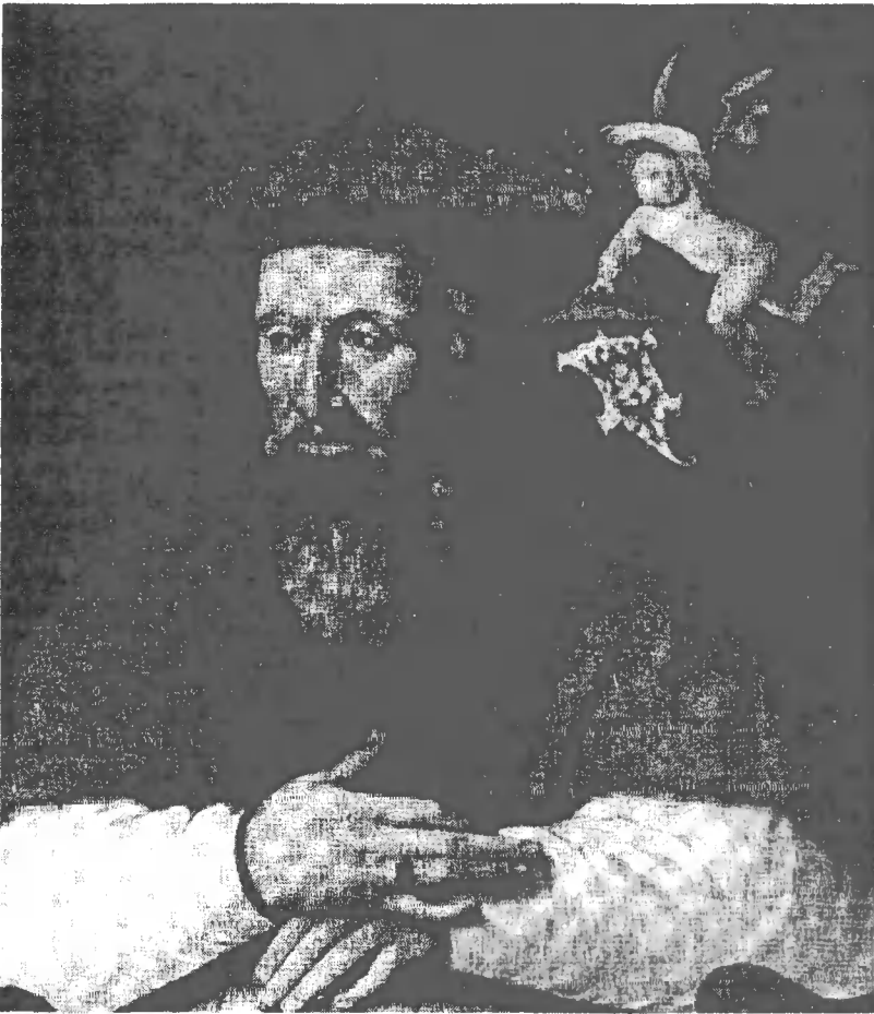
Kardinaal Willem van Enckenvoirt. Anoniem portret, 16de eeuw. Zwartzusters-augustinessen, Mechelen.