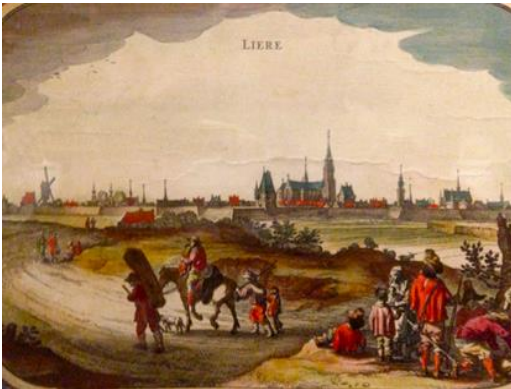
Lier in de middeleeuwen

Lier is een stad in de provincie Antwerpen en ligt aan de samenloop van de Grote Nete en de Kleine Nete waar leuke boottochtjes worden gemaakt. Lier heeft als bijnaam Lierke Plezierke . Het heeft veel historische monumenten zoals de Zimmertoren, het stadhuis op de grote markt en de Sint Gummarus kerk met schatkamer.