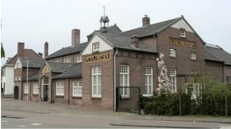
Monumentale pand van klokkengietenrij Petit & Fritsen Aarle-Rixtel