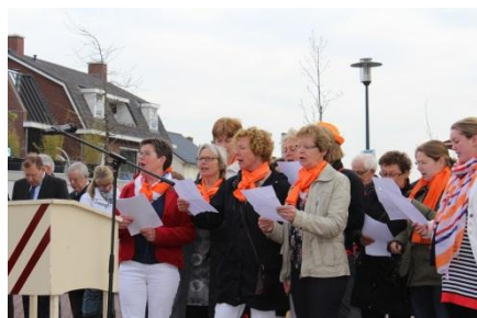
2013 Leden van Generation zingen het DKJO lied

Voor de 15 e keer richten we de Meiboom op. Dit jaar is het voor het eerst dat we niet op Koninginne- maar op Koningsdag samen met Harmonie St. Lucia, de Gilden, College van B en W, kinderen met versierde vervoersmiddelen een schild gaan onthullen aan de meiboom. Rond de Toren is de naam van ons wekelijks, gratis huis aan huis bezorgd parochieblad waarin naast mededelingen van de parochie ook informatie verschijnt van o.a. vele verenigingen in Mierlo. De medewerkers verzorgen ook het drukwerk van de kerk. In 1964 is het parochieblad dat geheel door vrijwilligers wordt gemaakt voor het eerst verschenen en is nu in onze gemeenschap niet meer weg te denken. Net als DKJO in 2013, hebben we nu dus al weer een "gouwe" waar we heel blij mee zijn.