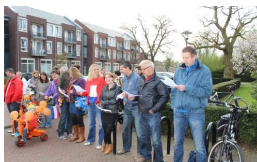
Ook het publiek zingt volop mee