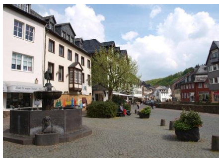
2013 Bad M nsterifel