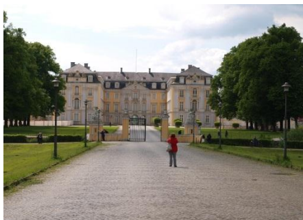
2013 Schloss Augustinusburg in Br hl