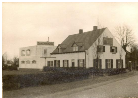
zaadhandel De Kim

Op dit moment is nog niet bekend wat het in 2014 zal worden, maar we hebben ook nog ruim de tijd om daarover na te denken en in onze foto en filmarchief te zoeken naar iets wat u zal boeien. Maar dat laten we met een gerust hart over aan de werkgroep Beeldcollectie.